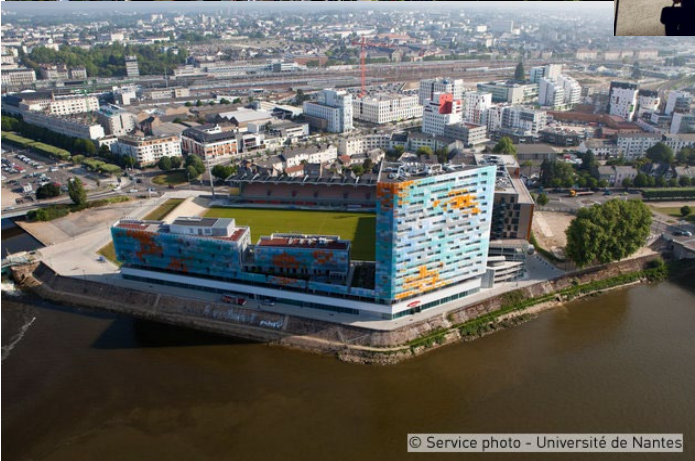
Maison des sciences de l'homme Ange Guépin (MSH) et Institut d'études avancées (IEA)