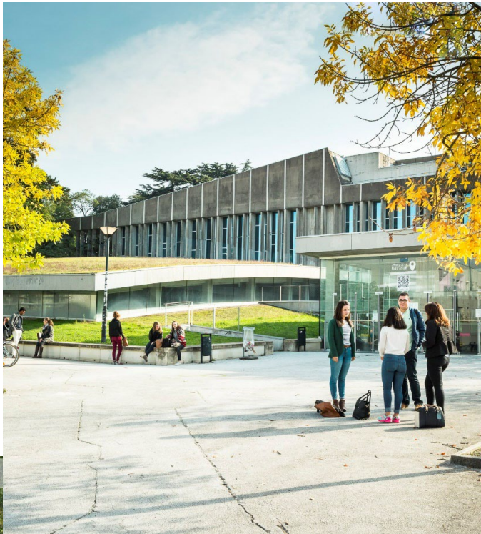
Faculté de droit et des Sciences Politiques de l'Université de Nantes